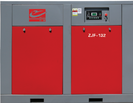
电动固定式螺杆空气压缩机技术参数