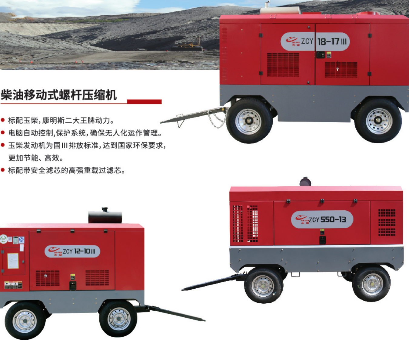
柴油移动式螺杆空气压缩机技术参数