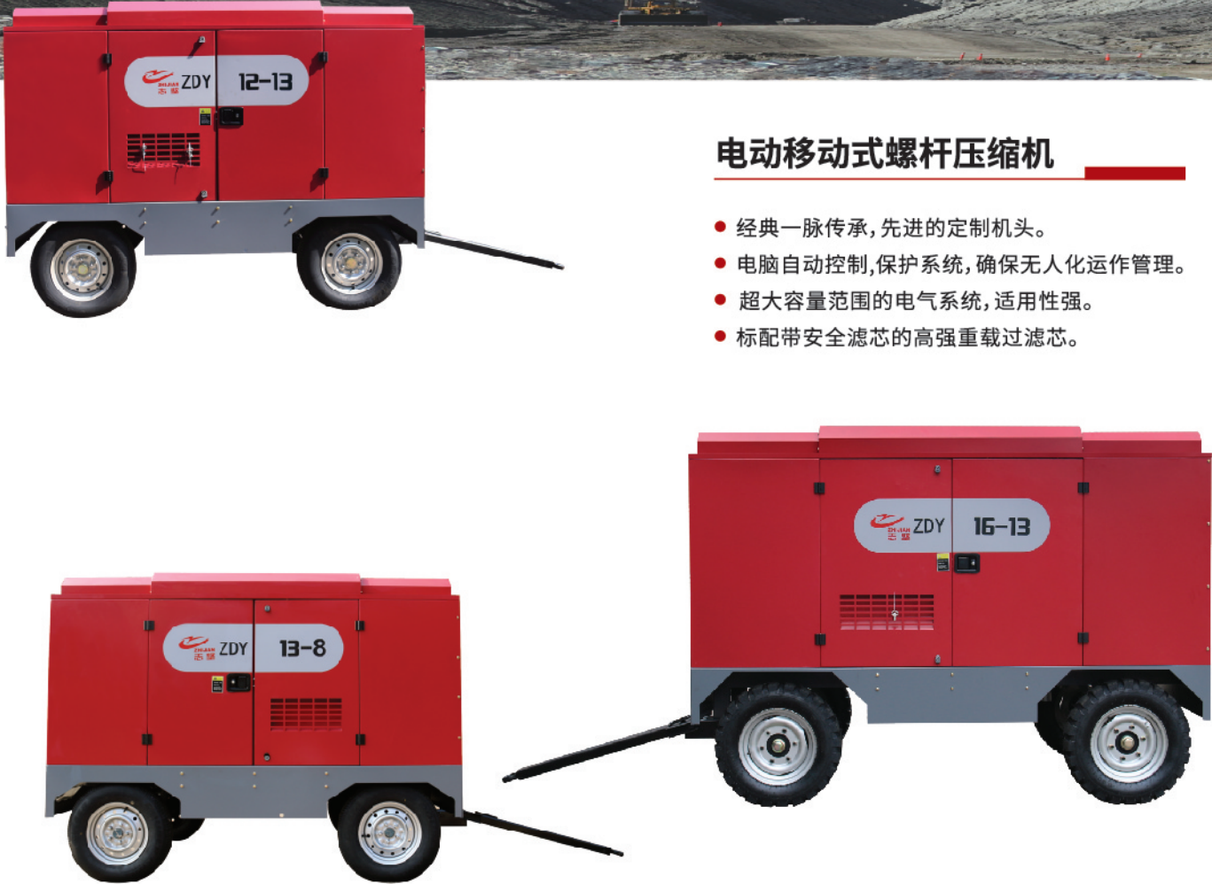
电动移动式螺杆空气压缩机技术参数